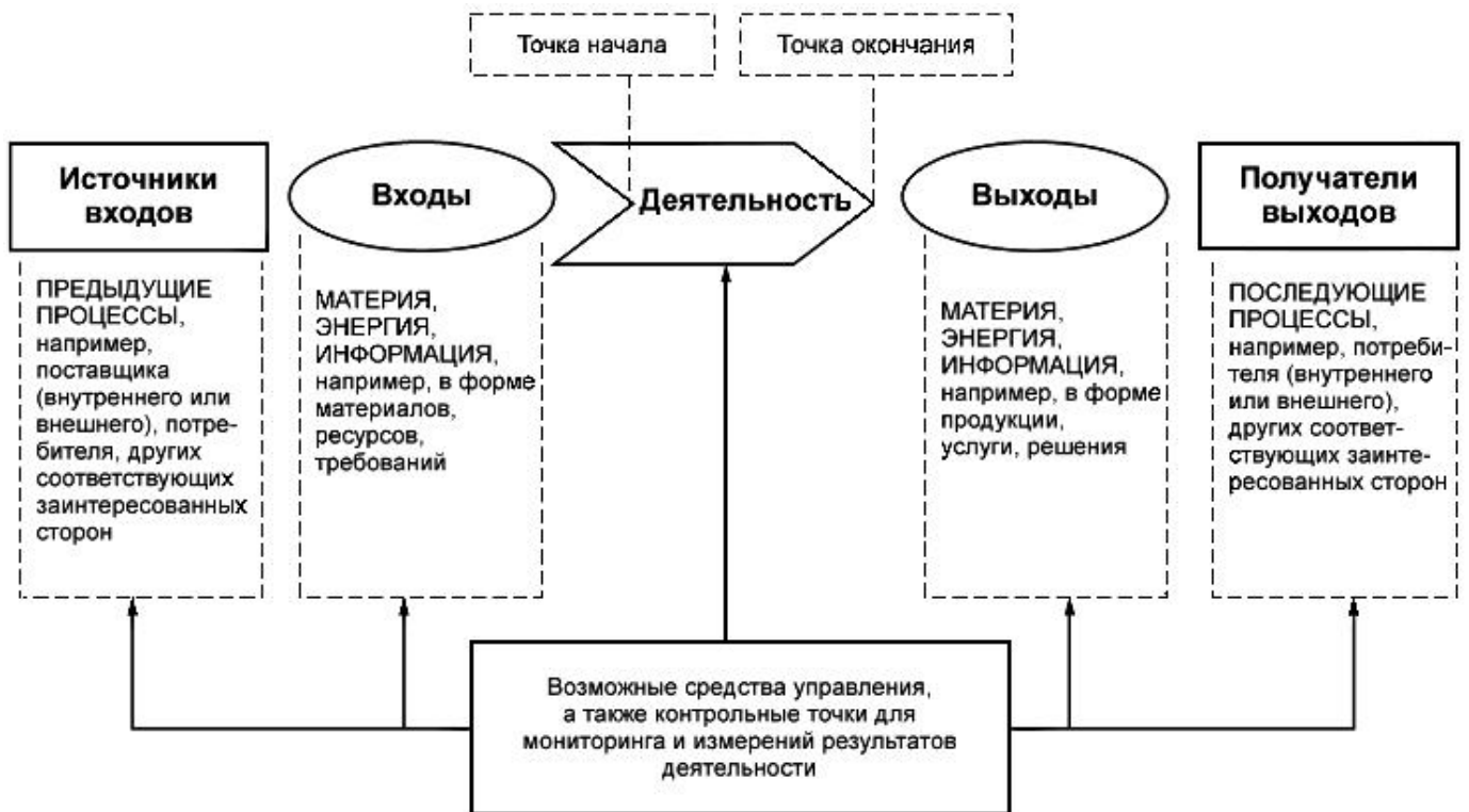
Рисунок 1 - Схематичное изображение элементов процесса