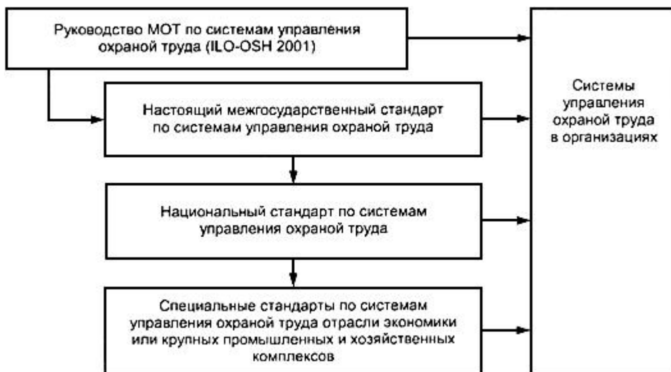
Рисунок 1 - Элементы национальных структур систем управления охраной труда